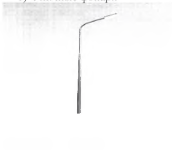
1) Уличные фонари

Визуализированный перечень образцов элементов благоустройства, предлагаемых к размещению на дворовой территории многоквартирного дома, сформированный исходя из минимального перечня работ по благоустройству дворовых территорий